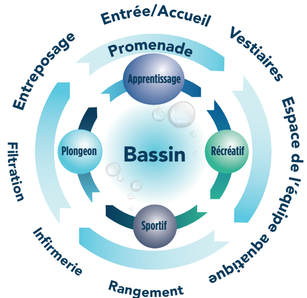
Figure 4 : Les espaces fonctionnels d'un lieu de baignade

Cette section présente les espaces incontournables dans la réalisation du lieu de baignade. D'autres espaces pourraient compléter le lieu de baignade, par exemple : régie, bureaux d'organismes, comptoir alimentaire, salle d'entraînement, salle de cours et de réunion, salle de réception.