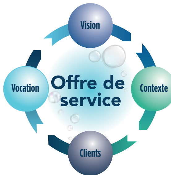
Figure 1 : L'analyse et la validation des besoins pour planifier l'offre de service

Lorsque les quatre aspects du projet (vision, contexte, clientèle, vocation) sont bien définis et que leurs interrelations deviennent claires, la mise en place de l'offre de services aquatiques, habituellement appelée programmation, est grandement facilitée.