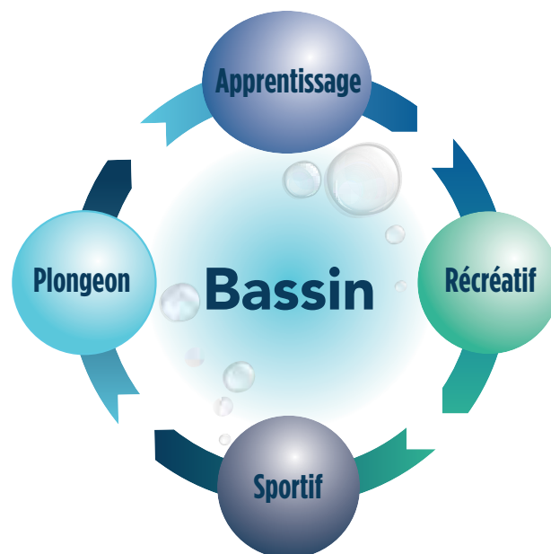
Figure 2 : Le bassin est l'élément central du lieu de baignade.

Les conseils présentés ne sont pas exclusifs et ont pour objectif d'accompagner l'équipe de conception dans la réalisation ou la modernisation d'un lieu de baignade. Il est essentiel de consulter l'exploitant du lieu de baignade et les fédérations sportives aquatiques afin de valider les besoins et les particularités de chacune des disciplines et activités.