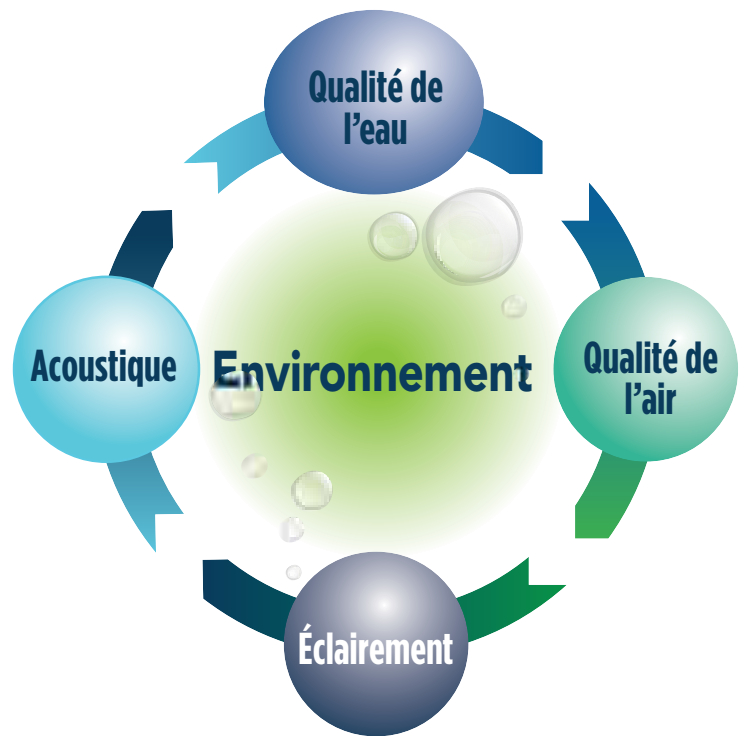
Figure 5 : Les environnements d'un lieu de baignade

Les conseils présentés ci-dessous, qui ne sont pas exclusifs, ont pour objectif d'orienter l'équipe de conception dans la réalisation ou la modernisation d'une installation aquatique. Il est essentiel de consulter l'exploitant du lieu de baignade et les fédérations sportives aquatiques pour connaître les besoins et les particularités de chacune des disciplines et activités.